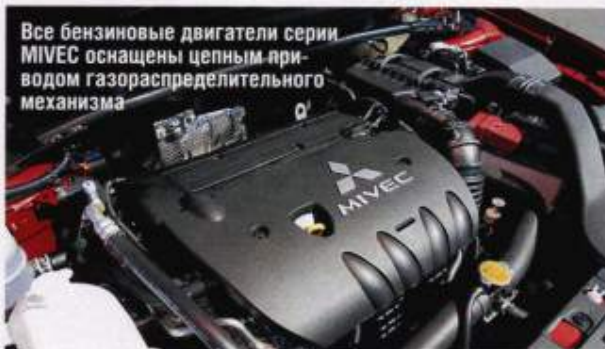
Все бензиновые двигатели серии MIVEC оснащены цепным приводом газораспределительного механизма